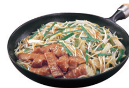
こてっちゃん牛もつ炒め

〔製品事業〕におきましては、「こてっちゃん」ブランド充実策として「こてっちゃん牛もつ炒め」をリニューアルすると共に、消費者キャンペーンを実施いたしました。