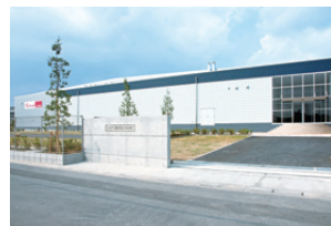
東京営業所 (関東ミートセンター)

当連結会計年度後半におきましても、景気回復は期待しがたく、食肉業界においても引き続き低価格志向が続くものと予想されます。この環境下において、当社グループは、更なるコストダウンとグループ企業間の協力関係の促進により、収益性の向上に努めて参ります。また、本年9月に当社最大級の処理能力を持つ新たな東京営業所