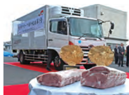
神戸ビーフ初輸出

食肉流通の川上領域においては、前連結会計年度から着手した北海道における養豚事業の生産量など事業規模の拡大に向けて引き続き注力するとともに、牛肉事業においても、岩手県で六次産業化(注)ビジネスに着手いたしました。