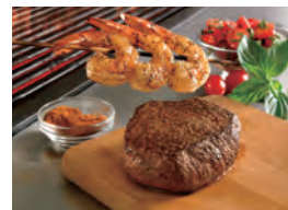
アウトバックステーキハウス ステーキメニュー例

食肉流通の川下領域においては、食肉等の小売事業で、既存店活性化や新店の確実な立ち上げに引き続き注力するとともに、グループ内における物流センターの共有化、PB商品開発等を行いました。また、食肉等の外食事業では、米国の「アウトバックステーキハウス」チェーンの日本での独占フランチャイズ権を取得し、事業に新たなラインを加えました。