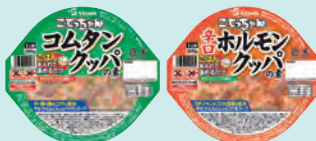
レトルトアルミ鍋こてっちゃん コムタンクッパの素