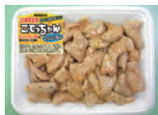
こてっちゃんにんにく塩味 (30周年記念期間限定)

・グループ経営の向上においては、引き続き効率的なグループ取引活動の推進、安全・安心な食品の供給体制固め、及び人材育成並びに