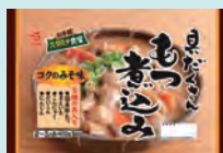
スタミナ食堂 具だくさんもつ煮込み