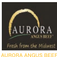
AURORA ANGUS BEEF