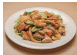
こてっちゃんコク味噌味(調理例)

食肉等の小売事業においては、イベント型の提案販売やレイアウト再構築等の既存店活性化を継続実施した他、生産性向上のために作業工程の見直し、適正な人員配置のためのシフトコントロールを強化しました。また、既存店の改装や不採算店の閉鎖、新規